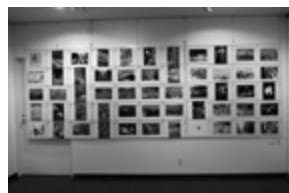
5段掛 横方向の展示です